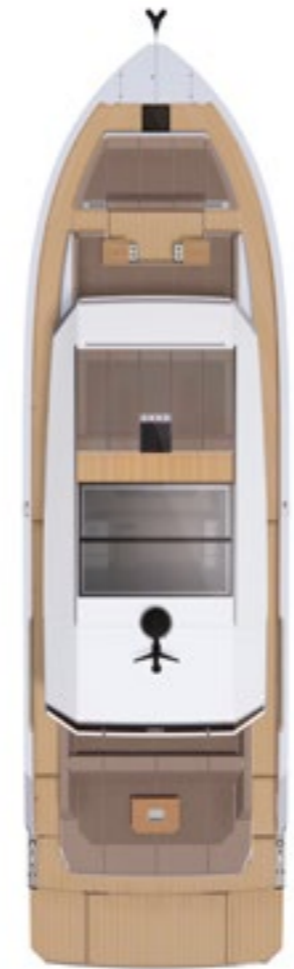
Bow hard top sun deck std.