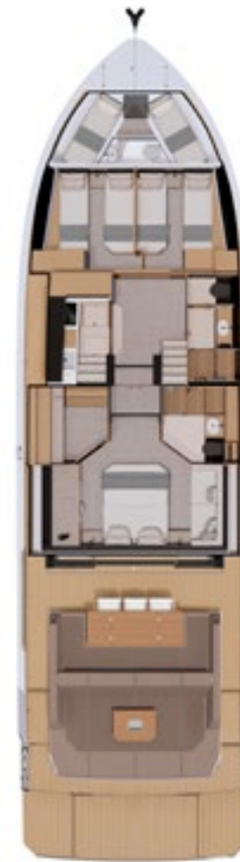
Bow 2 twin cabins opt.