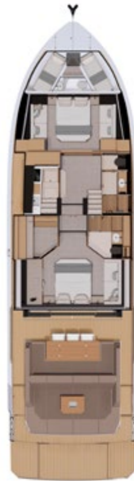
Bow double cabin std.