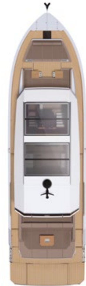
Bow hard top sliding glass roof opt.